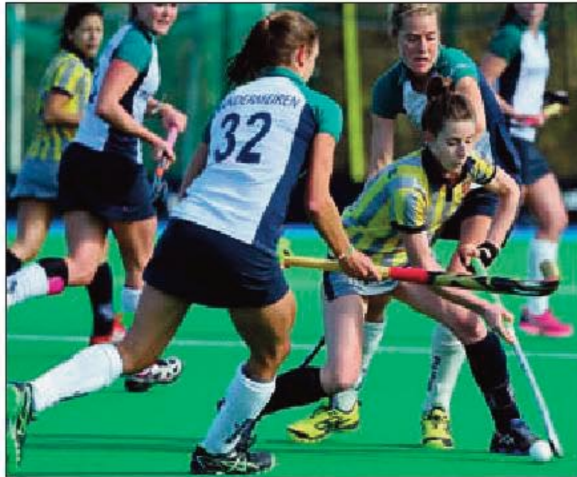
Une nouvelle finale Braxgata-Wellington ? Pas sûr mais possible...

L'autre équipe la plus citée pour le titre est le Braxgata. Les finalistes malheureuses de la saison passée ont pris de l'âge - et de la maturité - et recruté Terblanche pour compenser le départ de Harrison. Malheureusement, elles