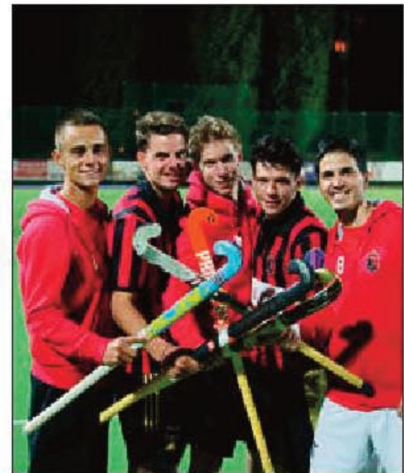
Cinq nouvelles têtes pour le Daring.

2004/2005 : 10 e en D2 2005/2006 : 5 e en D2 2006/2007 : 4 e en 1B 2007/2008 : vainqueur en 2C 2008/2009 : 4 e en D1 2009/2010 : 4 e en D1 2010/2011 : champion en D1 2011/2012 : 10 e 2012/2013 : 5 e 2013/2014 : 3 e